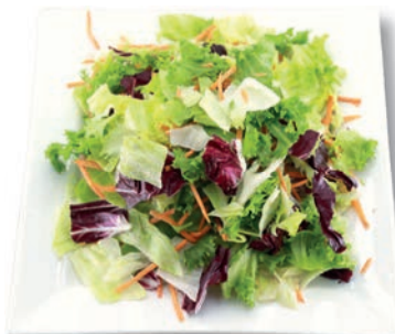
Donnerstag Mix Möhren, Eisbergsalat, Frisee, Radicchio