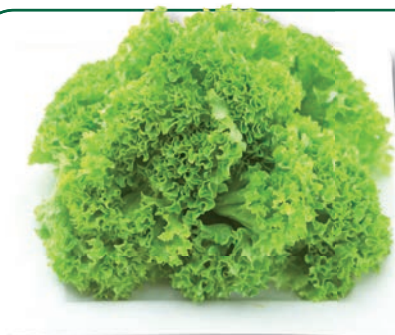
Lollo Bionda Blätter