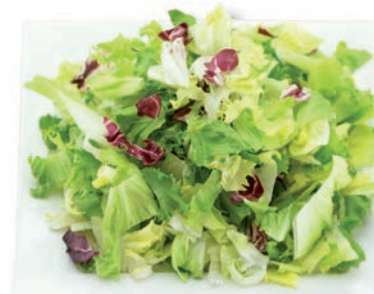
Pariser Salatmischung Endivie, Frisee, Radicchio