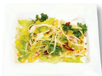
Hanseaten Mix Eisbergsalat, Frisee, Mais, Radieschen, Weißkohl, Radicchio