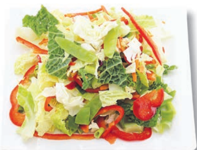
Wokpfanne Thailand Wirsingkohl, Möhren, Weißkohl, Paprika, Lauchzwiebeln, Zuckerschoten