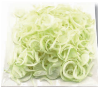
Zwiebeln Ringe, 4 mm