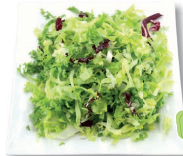
Feiner Salatmix 6 mm: Eisbergsalat, Frisee, Endivie, Radicchio