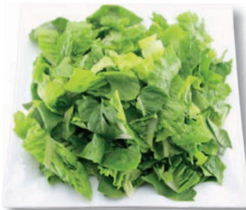
Romana grob geschnitten, 25 mm