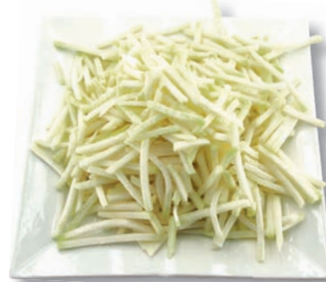
Kohlrabi Stifte, 5 mm