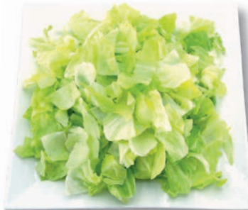
Eisbergsalat grob geschnitten, 25 mm