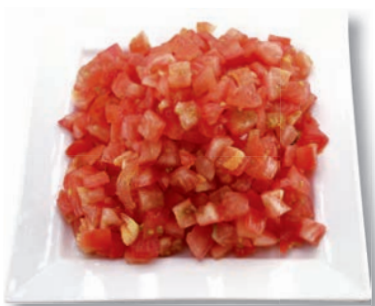
Tomaten Würfel, 15x15 mm