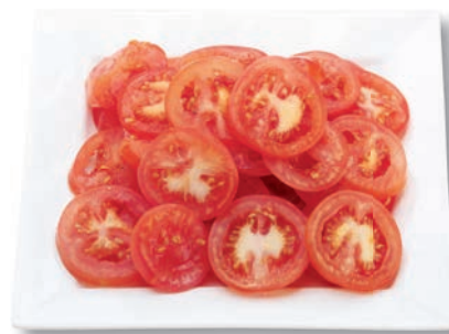
Tomaten Scheiben, 4 mm gelegt