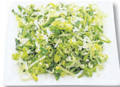
Porree fein, 4 mm