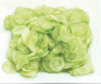
Gurken geschält Scheiben, ohne Schale, 4 mm