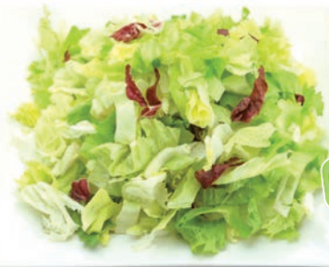
Heide Mix Eisbergsalat, Chinakohl, Frisee, Radicchio