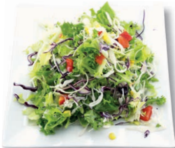
Dienstag Mix Weißkohl, Frisee, Mais, Rotkohl, Paprika