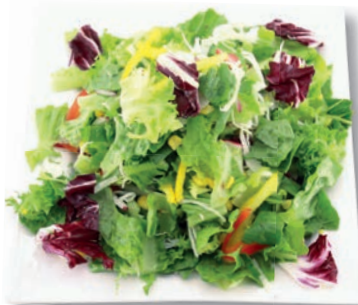
Casino Mix Romana, Frisee, Mais, Weißkohl, Paprika rot und gelb, Radieschen, Radicchio