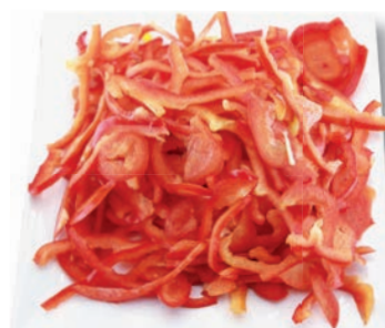
Paprika rot Streifen, 4 mm