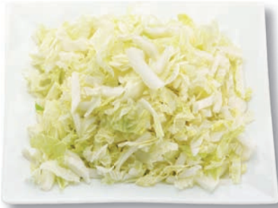
Chinakohl fein geschnitten, 6 mm