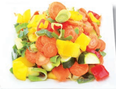
Gemüsemix Provence Möhren, Porree, Zucchini, Paprika rot und gelb