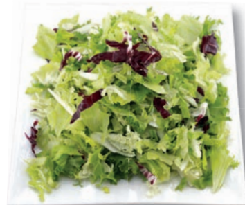
Mittwoch Mix Chinakohl, Eisbergsalat, Frisee, Radicchio