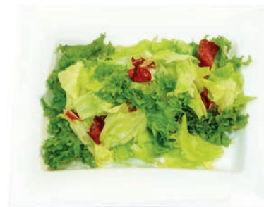
Kalifornia Mix Eisbergsalat, Frisee, Radicchio