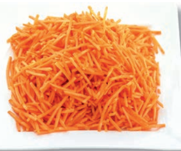
Möhren Julienne, 1,6 mm