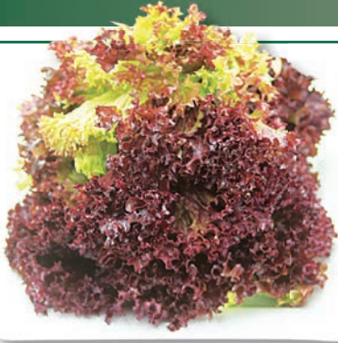
Lollo Rosso Blätter