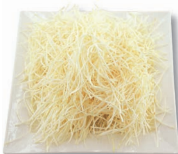
Sellerie Julienne, 1,6 mm