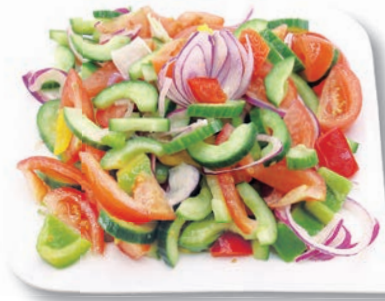
Rusticana Mix Gurken-Halbmonde, Paprika bunt, rote Zwiebeln, Mais