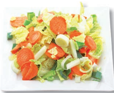
Gemüsemix Altes Land Möhren, Wirsingkohl, Porree, Kohlrabi