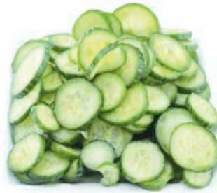
Gurken ungeschält Scheiben, 4 mm