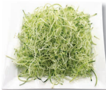
Zucchini Julienne, 1,6 mm