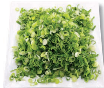
Lauchzwiebeln fein, 4 mm