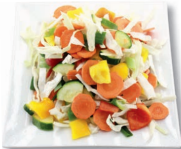
Bunte Wokpfanne Weißkohl, Karotten, Zucchini, Paprika bunt, Lauchzwiebeln