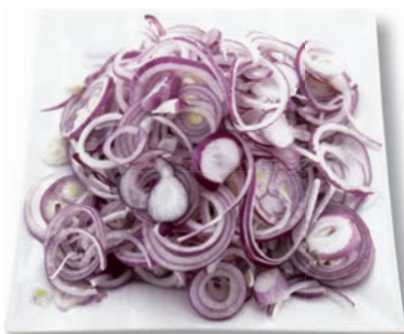
Zwiebeln, rot Ringe, 4 mm