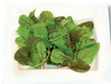
Wildkräuter- salat Tatsoi, Red Mustard, Landkresse, Mizuna, Spinat, Red Chard