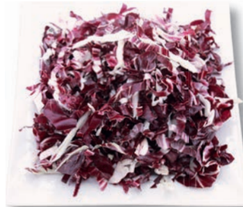
Radicchio fein geschnitten, 6 mm