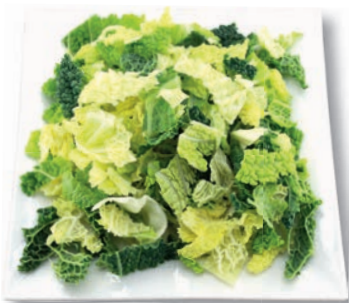
Wirsingkohl blättrig, 20 mm