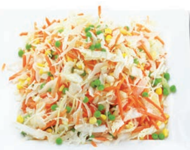
Nizza Mix Weißkohl, Möhren, Chinakohl, Mais, Erbsen

Lollo Rosso, Lollo Bionda, Eichblatt rot & grün, Radicchio, Rucola