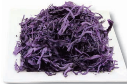
Rotkohl fein, 2 mm