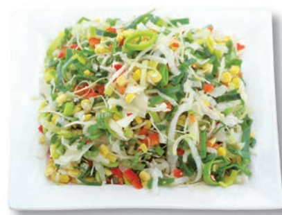
Bremer Mix Mais, Weißkohl, Porree, Paprika rot