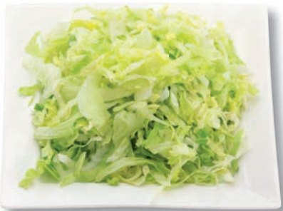
Eisbergsalat fein geschnitten, 6 mm