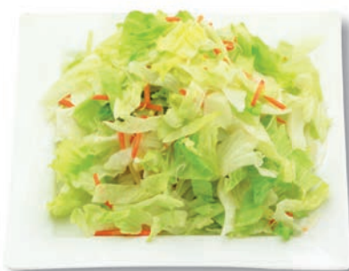
Garten Mix Weißkohl, Eisbergsalat, Möhren, Endivie