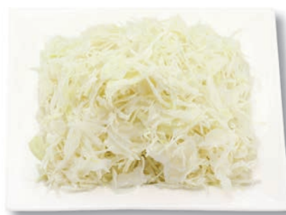
Weißkohl fein, 2 mm