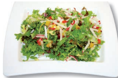
Amsterdamer Mix Frisee, Radieschen, Paprika rot und gelb, Chinakohl, Radicchio, Lollo Rosso, Lollo Bionda