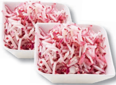
Radieschen Julienne, 1,6 mm