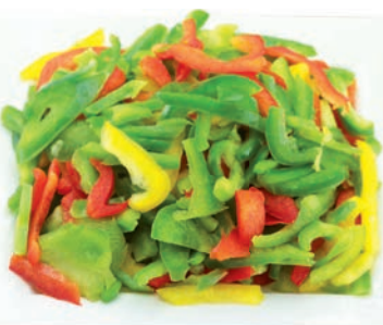
Paprika bunt Streifen, 4 mm