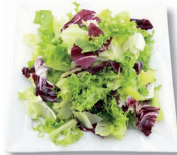
Montag Mix Eisbergsalat, Frisee, Radicchio