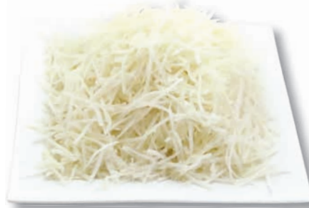
Rettich Julienne, 1,6 mm