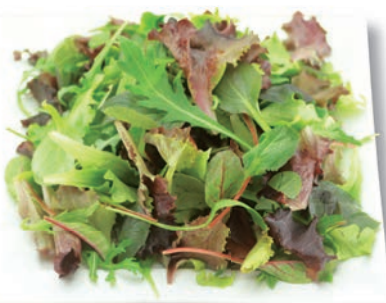
Baby Salatmix Salatmischung aus verschiedenen Sorten Baby Leaf