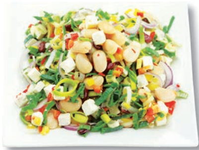
Texas Mix Porree, Hirtenkäse, Paprika rot und gelb, weiße dicke Bohnen, Kidneybohnen, rote Zwiebeln