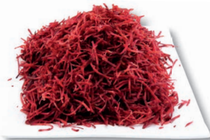
Rote Bete Julienne, 1,6 mm