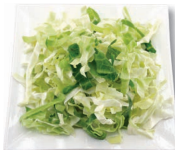
Spitzkohl Streifen, 10 mm