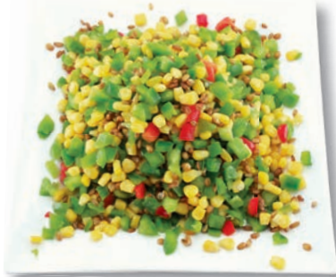
Berner Vollwert Mix Mais, Paprika bunt, Weizen, Roggen