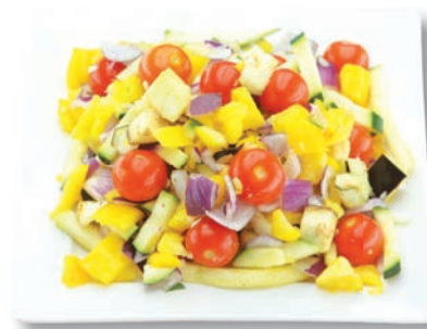
Gemüsemix Mediterran Paprika gelb, Zucchini, rote Zwiebeln, Cocktailtomaten, Auberginen