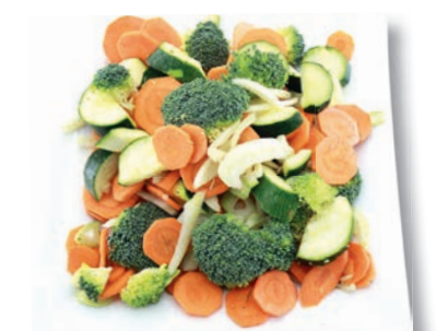
Wokgemüse Vital Zucchini, Möhren, Broccoli, Fenchel