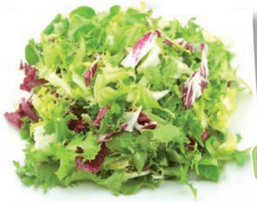
Herkules Mix Frisee, Radicchio, Feldsalat