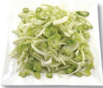
Fenchel geschnitten, 5 mm