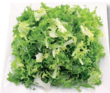
Frisee grob geschnitten, 25 mm