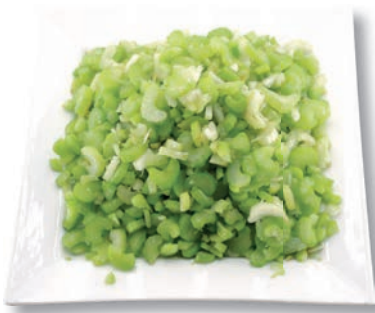
Staudensellerie Scheiben, 4 mm