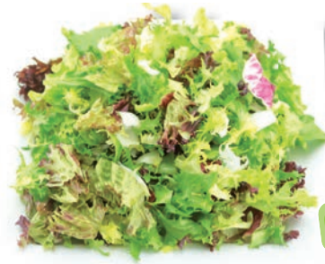
Manhattan Mix Lollo Bionda, Lollo Rosso, Frisee, Radicchio, Rucola