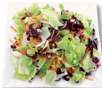
Freitag Mix Eisbergsalat, Möhren, Mais, Radicchio