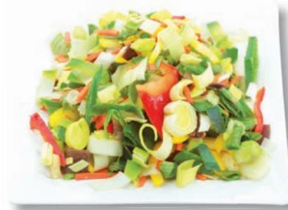
Wokpfanne Bombay Porree, Möhren, Ananas, Paprika rot und gelb, Staudensellerie, Mu Err Pilze