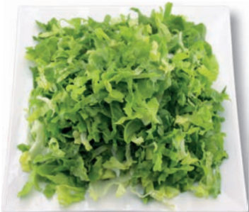
Endivie fein geschnitten, 6 mm