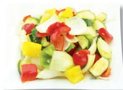
Ratatouille Zucchini, Paprika bunt, Zwiebeln, Auberginen