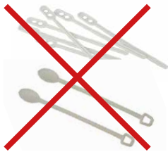
Rührstäbchen aus PS oder CPLA