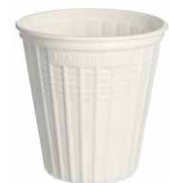
Suppenbecher aus PP - recyclebar -