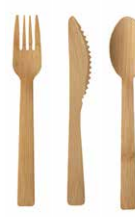
Besteck aus Bambus