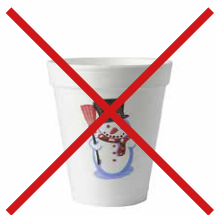
alle Einmalartikel aus EPS (Expandiertes Polystyrol) wie Thermobecher