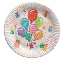
Pappteller mit Motiv - ohne Kunststoffbeschichtung - „Plastic Free Party!“