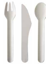
Besteck aus Papier