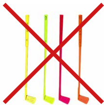
Getränkequirle aus PS oder CPLA