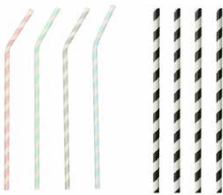
Trinkhalme aus Papier