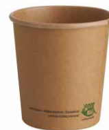
Suppenbecher aus Pappe mit Bio-Beschichtung