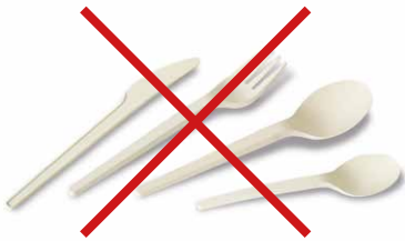
Besteck aus PS und aus C-PLA