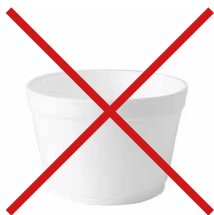
Suppenbecher aus EPS