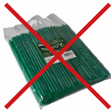
Trinkhalme aus PLA