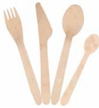
Besteck aus Holz